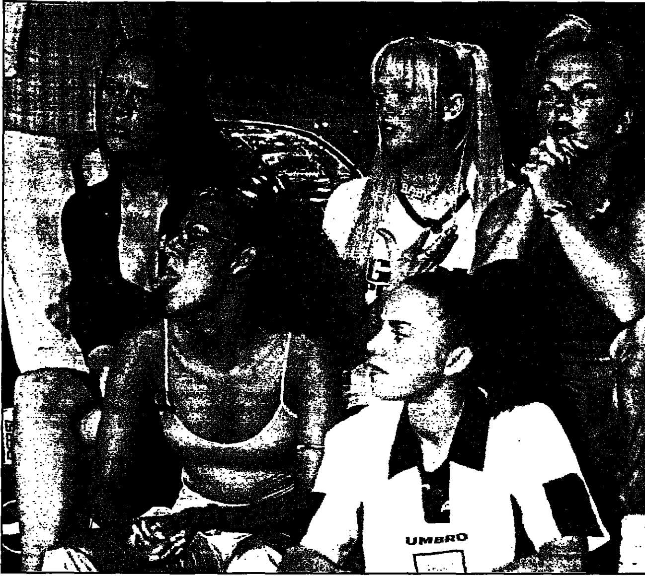
فريق سياسيين غيرونه الانكليزي وصل الى اسطنبول ليوم واحد للحملة للحل النهائي الذي سيقام في تشرين الاول (اكتوبر) المقبل

ولا يخبى زبائن مكتبة ابوتوك غيرهم من زوار المكتبات. فهم غالبا ما يطلبون عدم كشف هوياتهم على غرار زبائن اوساها في بعض الكتب مضمينا ان يحمل المثل اسم المكتبة لئلا يظهر اسمه وعنوانه الى من السجلات.